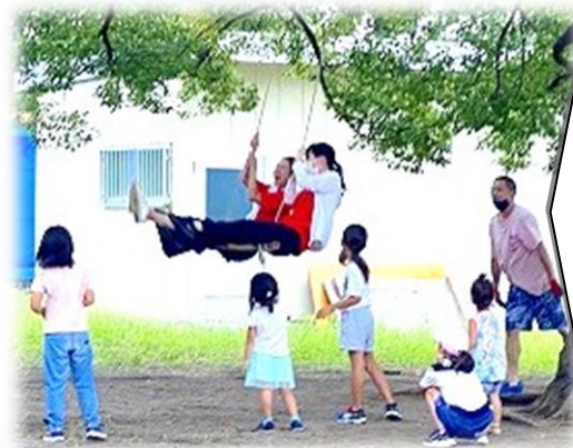
大人も楽しめるブランコ プレバに来たらみんな1回は 乗ってみてね。