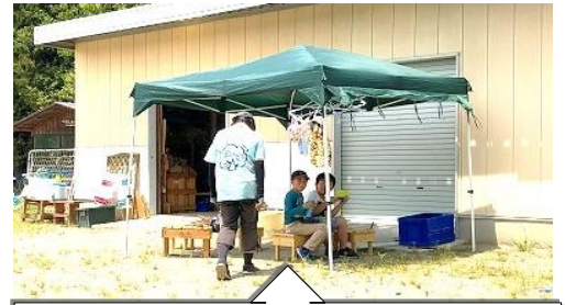
倉庫前にも簡易テントを置いて日陰を作った。