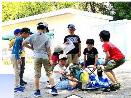
七輪を使う前にみんなで段取りを相談中。何から焼こうかな…