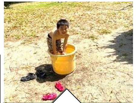
あまりの暑さに水遊び第1号！「たる」に水を入れてちょっとだけ水浴びをする子もいたよ。

これを舌の上に乗せて勢いよく息を吹くと音が鳴る。その音が「シビー、シビー」って聞こえるから『シビビー』って呼ばれているらしい。次にまた遊べるのは来年の5月かな。楽しみだなあ。