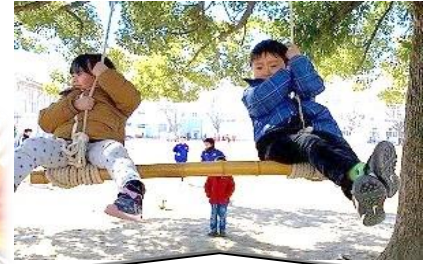
ブランコもやったよ！

今年のラインナップは、いちご・バナナ・マシュマロ・薄焼きクッキー・ポテトチップス・ビスケット でした。どれもおいしかった～！