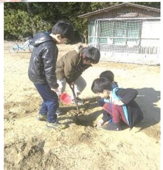
2月にしては暖かな1日だった。 いっぱい食べた後は、砂場で穴掘りも。

今年のラインナップは、いちご・バナナ・マシュマロ・薄焼きクッキー・ポテトチップス・ビスケット でした。どれもおいしかった～！