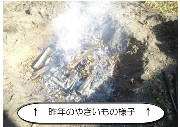
↑ 昨年のやきいもの様子 ↑

「自分で持ってきたおいもが食べたい」という人は持ってきて もいいよ。 でもね、たき火の中で一度にたくさん焼くから、どれが自分の おいもか分からなくなるからね。 本当に、ぜったいに分からなくなるからね。 「自分のはこれだ」とか言って、言い争いになるかもしれない。 それでも良ければ、持ってきてもいいよ。