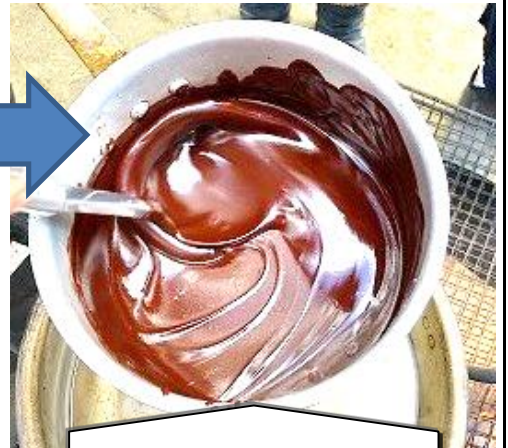
溶けたら準備完了！

「チョコができたよー！」の声を合図に、苺やバナナ、パンにマシュマロなど思い思いの食材をくしに刺し、甘いひと時を過ごした。