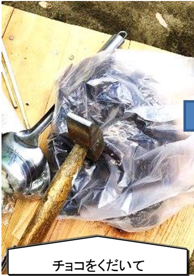
チョコをくだいて

遊びに来た子どもたちから「〇〇持ってきた！」と食材の報告がある中でチョコフォンデュの準備開始。