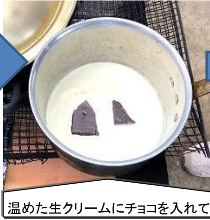
温めた生クリームにチョコを入れて