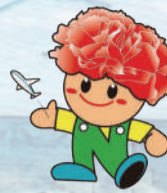
名取市マスコットキャラクター カーナくん