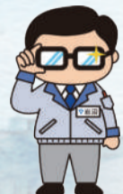
岩沼市マスコットキャラクター 岩沼係長