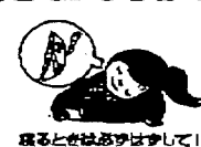
戻るときは必ずはずして!