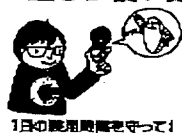
1日の使用時間を守って!