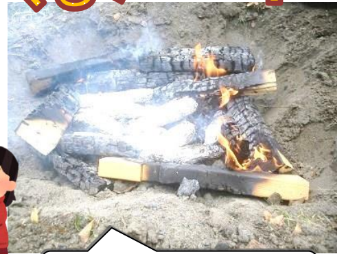
昨年の焼き芋の様子です。

「自分で持ってきたおいもが食べたい」という人は持ってきてもいいよ。 でもね、たき火の中で一度にたくさん焼くから、どれが自分のイモか分からなくなるからね。 それでも良ければ、持ってきてもいいよ。