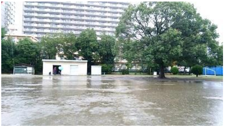
↑ 校庭は大きな水たまり

残念ながら朝からどしゃぶりの雨。 少しの雨ならやるんだけど・・・さすがに 校庭もどろどろだし・・・ということでお昼 前には解散してしまいました。う〜ん、 残念・・・