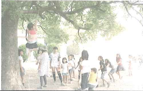
↑綱引きのように、みんなでロープを引っ張って、ひとりの人を上にあげています。

朝九時過ぎ 子どもたちは、七輪を出してバケツに水を汲んで、着々と火を焚(た)く準備を進めているけれど、風が強い・・・ちよつと待って、少し様子を見よう。 火を焚くのは、もう少し風が弱まるまで、ひとまずお預けておくこと。 十時、風は弱まるどころか、ますます強くなるばかり・・・