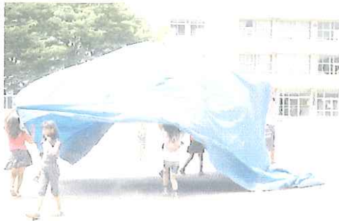
風でふくらむブルーシートで遊ぶ。

結局、風はますます勢いを増してプレパーク終了時まで続き、終わり近くには、砂嵐のようになつたりも。 七輪使えなくて(火遊びできなくて)、よっぽど不満を訴えられるかと思つたけど、みんな聞き分けが良かった。 そうさ、プレパークは、火遊びだけじゃあ、ないからね。