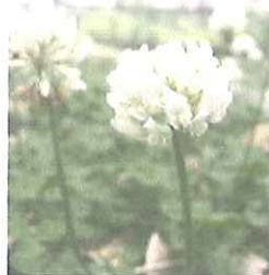
シロツメクサの花

いつもブランコでにぎわうクスノキに、花が咲いていた。 地面にはシロツメクサの花。 花輪を作った幼き日の情景が、甘い花の香りによみがえる。 今ごろの季節だったか・・・ (かんぼ)