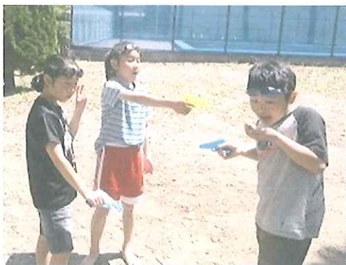
まじモードの水かけっこ

前回(4月のプレパ)の‘水かけっこ’が、とーっても楽しかったらしく、朝9時、やる気満々、軽装にゴーグルまで装着して、最初っから本気モードで登場した子たちがやって来た。