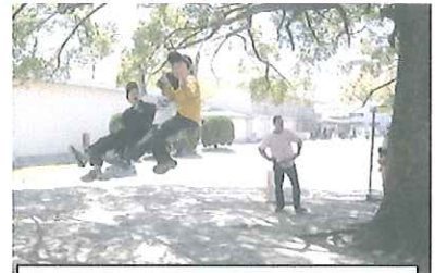
↑名物、クスノキブランコ。

からりと晴れて良い天気。戸外で過ごすには良い気候だった。天気が良いから？、ゴールデンウィーク前でお出かけしないから？、子どもたち多かったあ。