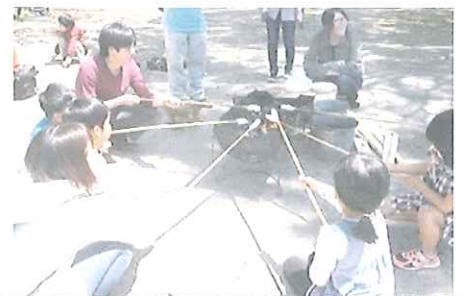
あそぼうパン、焼いています。

前回(4月のプレパ)の‘水かけっこ’が、とーっても楽しかったらしく、朝9時、やる気満々、軽装にゴーグルまで装着して、最初っから本気モードで登場した子たちがやって来た。