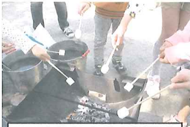
マシュマロ、焼いています。