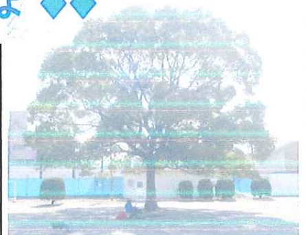
↑ シンボルツリーのクスノキ。ここに、ブランコがかけられます。