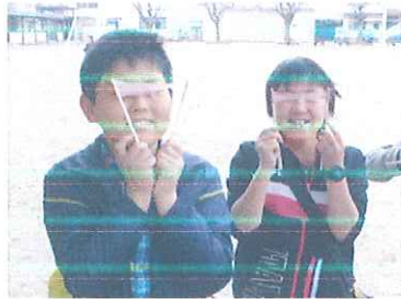
さて、わたしはだれでしょう？

ふつうの公園ではできない遊びが、いろいろできるよ。ふるじろプレーパークに遊びにおいでー