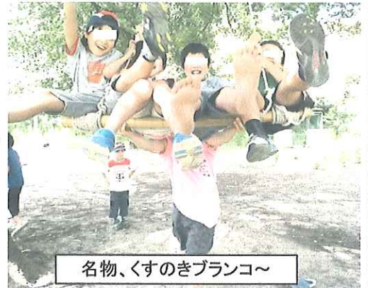
名物、くすのきブランコ～