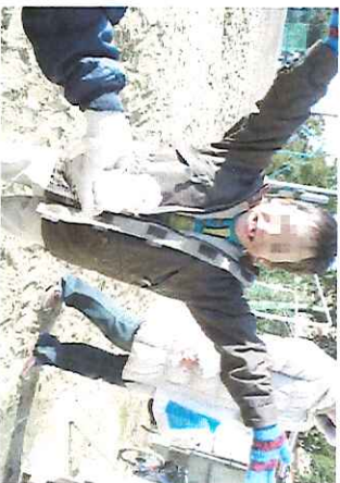
ちっちゃな雪だるま

先月から、市内幾つかの授業の一環として参加してくれた方の中には、先月来てくれた3人も。(続けてくれて、ありがとうございます！)