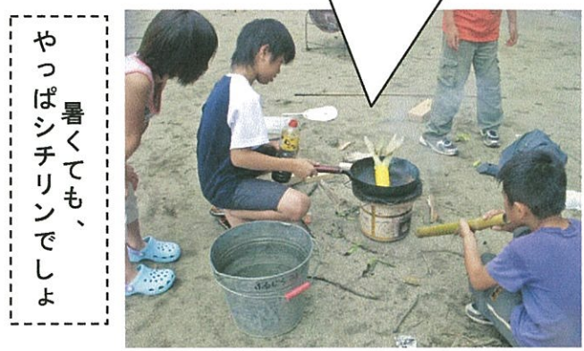
やっぱり暑くても、シチリンでしょ

涼しくても、やっぱり「夏はプール」なのだ。 気まぐれで意地悪な天気をちょっぴりうらみつつ、でもでも、ミニミニプールは楽しかったし、雨が降って水たまりができれば、どろんこになって遊べる。