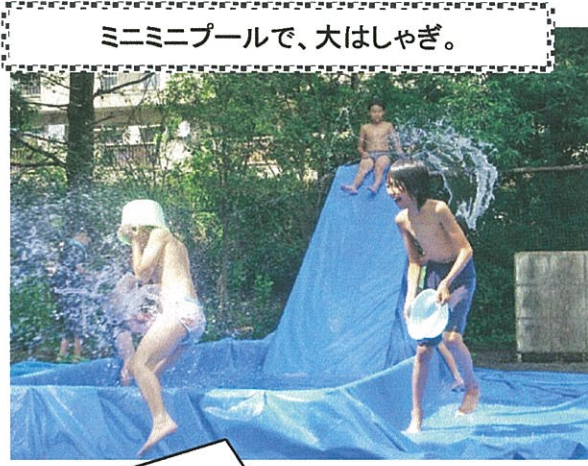
ミニミニプールで、大はしゃぎ。

夏になっても、シチリンの人気がおとろえない。 調理をしようとするれば、やっぱり火を使うことになるんだな。 少し涼しかったといっても、やっぱり夏だから暑いのだ。 そんな中、おいしいものを食べようと思うと、暑さをガマンして、汗をかきながら火をたき、そして、できたてのあつあつを食べる。 これ 最高だね！