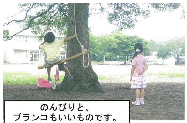
のんびりと、ブランコもいいものです。

涼しくなってくると、熱中症の心配が少なくなるので、外遊びがたのしくなるから、それはそれでうれしいのだけど。 でも、楽しみにしていたミニミニプールに入るのが、ちょっとつらくなったりもする。