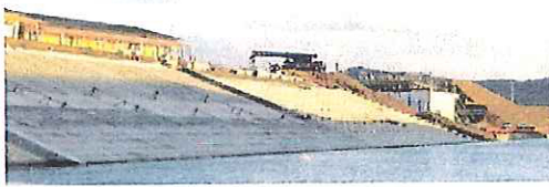
2016年12/30 新さんさん商店街(工事中)