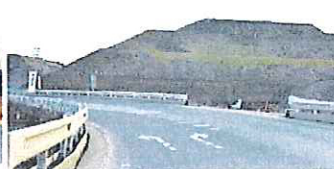
2016年12/30 町中が大古墳群のよう 高上げ工事の真っ最中。