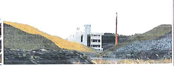
現在の高野会館。盛土に囲まれて残る。