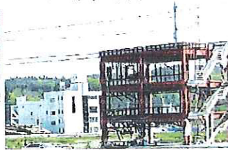
防災庁舎と高野会館