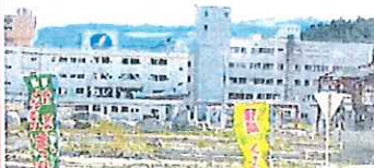
志津川病院と高野会館