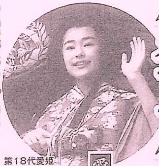
第18代愛姫 愛姫は田村藩(現在の福島県田村郡三春町)の城主(田村清頼)の一人娘として生まれ、数え12歳の若さで伊達政宗公に嫁いだといわれているお姫さまです。