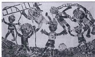
審査員特別賞「わたしたちのやすみじかん」 共同作品 石巻市立大川小学校1年